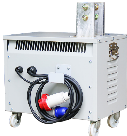
จุดต่อใช้งานด้านหลัง หม้อแปลงไฟฟ้า