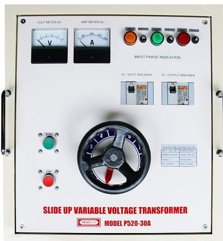
หน้าตู้ด้านบน VARIAC