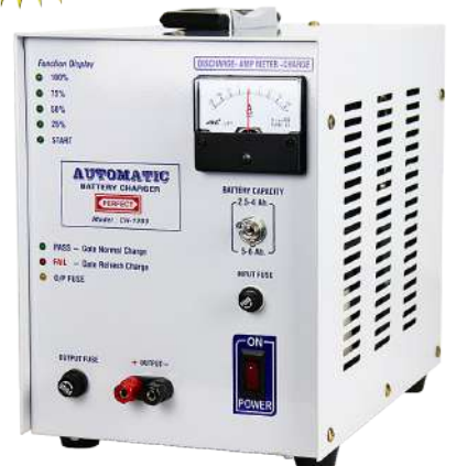
CH-1203 ( 1CH. )