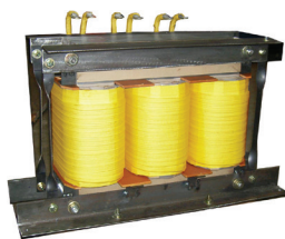
หม้อแปลง 3 เฟส แบบเปลี่ยนดีดเทอร์มินอล