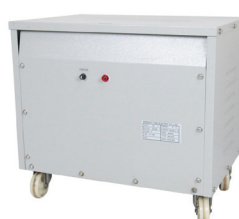
รุ่น PO-03 B