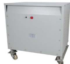
รุ่น PO-04, PO-05, PO-06