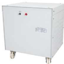
รุ่น PO-03 A