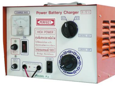
รุ่น PJ - 20A , PJ - 30A