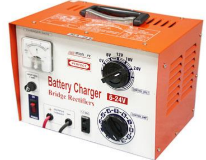
รุ่น PK-15A , PK-20A , PK-30A

ผู้ซ้ารัจจะเป้้าหิ้ว ทองแดงแท้ แอมป์เต็ม 100% รุ่นดีทีสุด รับประกัน 6 เดือน