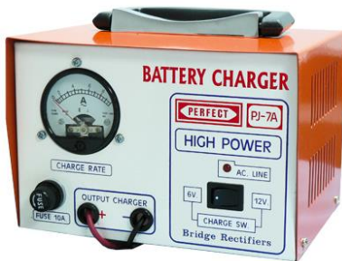
รุ่น PJ - 7A , PJ 100 (แอมป์มีเตอร์สีเหลี่ยม)